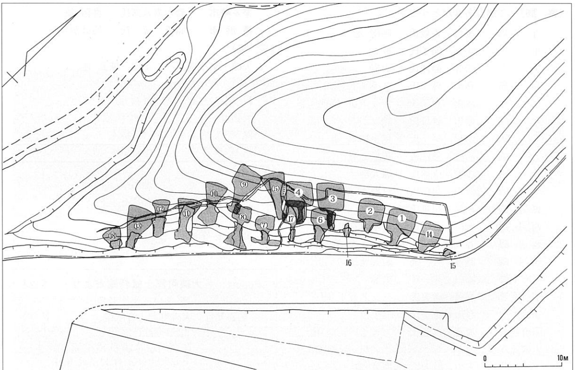
堂後下横穴墓群全体図(1/500)