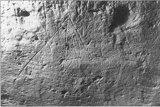
第3号墓 線刻画「船」(東→)