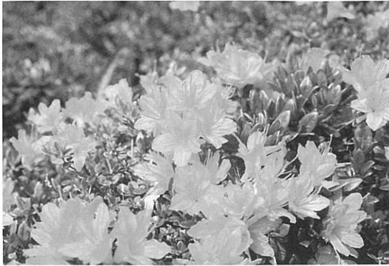
大磯城山公園に咲く サツキ

ゴールデンウィークの期間、近くの公園を散策したとき、必ずといっていいほど目につく植物といえばツツジがあげられると思います。郷土資料館のある大磯城山公園も同様に何種類かのツツジ科の植物が植樹されています。よく目に付くものと言えば、アセビ、サツキ、ドウダンツツジ、キリシマククルマツツジ、オオムラサキツツジがあります。アセビ、ドウダンツツジの花は、一つ一つの花は小さいものの一度にたくさんの花を咲かせるため非常に見栄えのよい印象を受けます。対して、サツキ、キリシマククルマツツジ、オオムラサキツツジは、比較的に大輪で色鮮やかな花を咲かせます。ツツジという名前の由来について、一説には筒状をした花を付けるためツツジと名付けられたというようなことがい