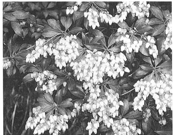
大磯城山公園に咲く アセビ

キリシマ、ククルマツツジも園芸品種として品種改良されたもので江戸初期より栽培されています。キリシマ、ククルマツツジは、その品種の数は、非常に多く、その数は、現在では、およそ300品種といわれています。色、形ともに多様であり、一口にキリシマ、ククルマツツジといっても交雑によってはその色合い、形質は格差があります。