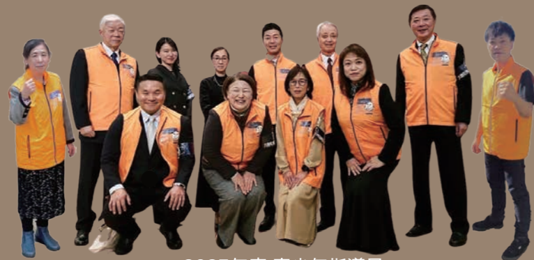
2023年度 青少年指導員