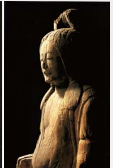
▲木造女神形立像(六所神社所蔵)