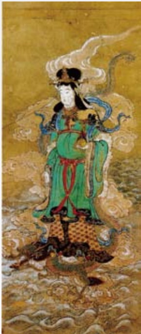
▲伝稲田姫命像(六所神社所蔵)

神奈川県大磯町に鎮座する六所神社は平安時代より相模国総社として国府、そして相模国の信仰を集めてきました。そして長い月日を経た今日まで、多くの資料が当地に残されました。それら資料を今回の展示でご紹介します。