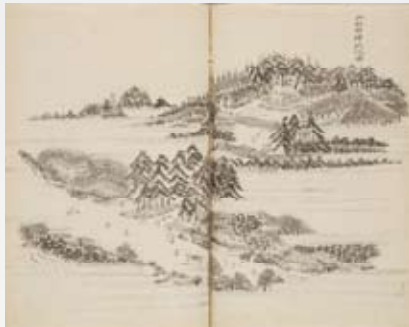
▲新編相模国風土記稿(国立国会図書館所蔵)