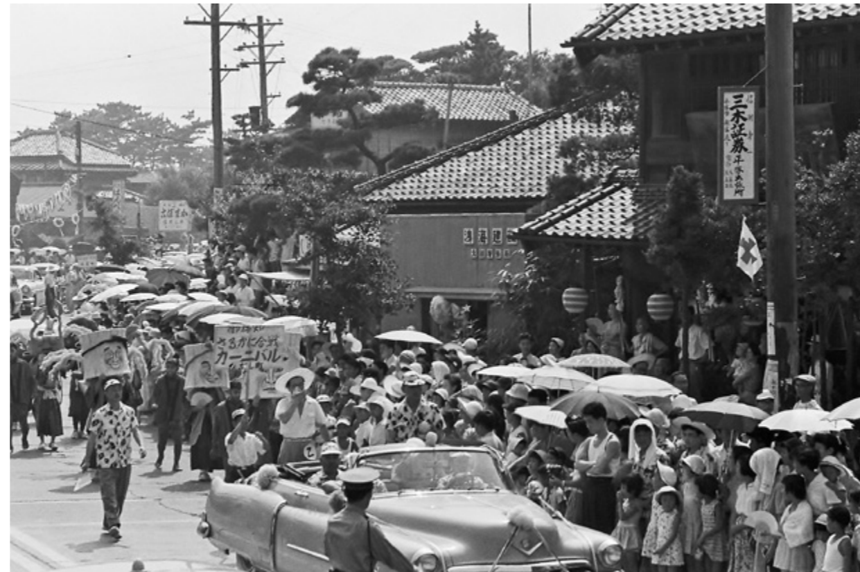
「御承知さるかに合戦」（東町）の仮装