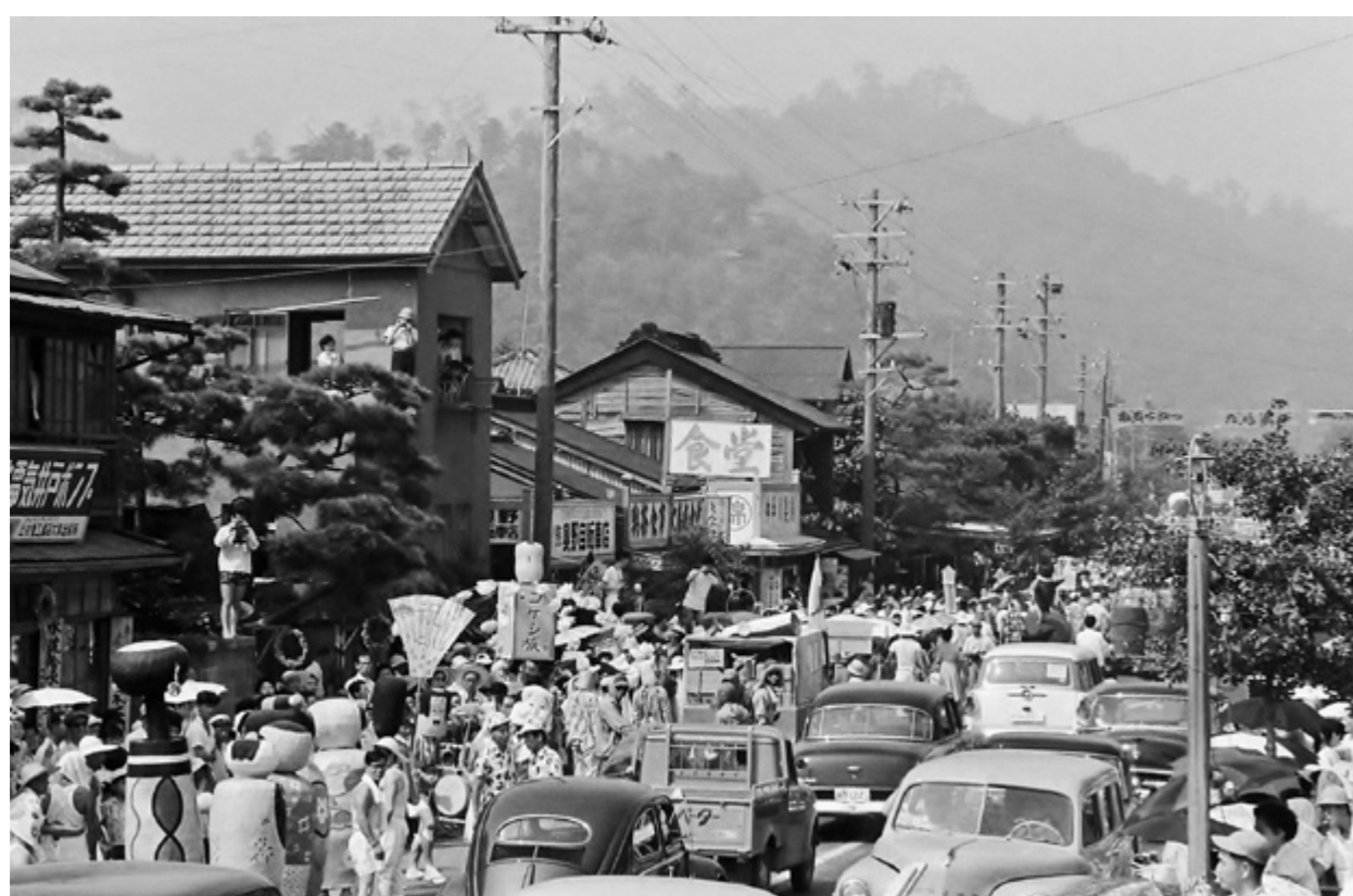
「こけし族」（長者町）の仮装