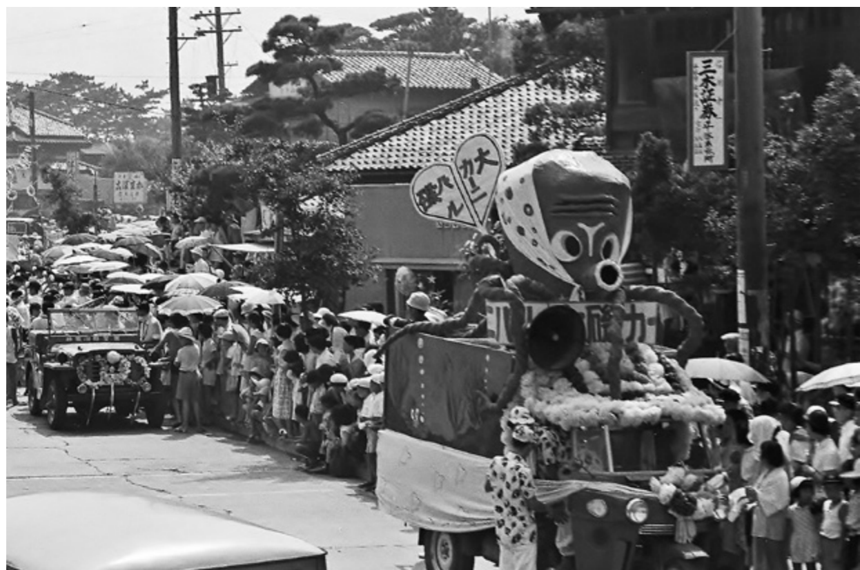
奥に井上かまぼこ店の看板が見える