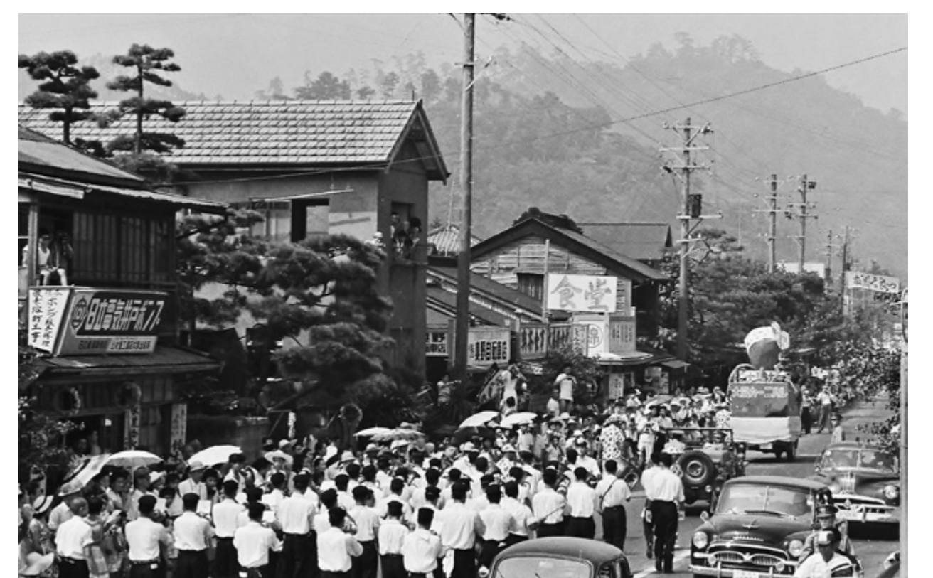
奥は大藤軒食堂（南本町付近）