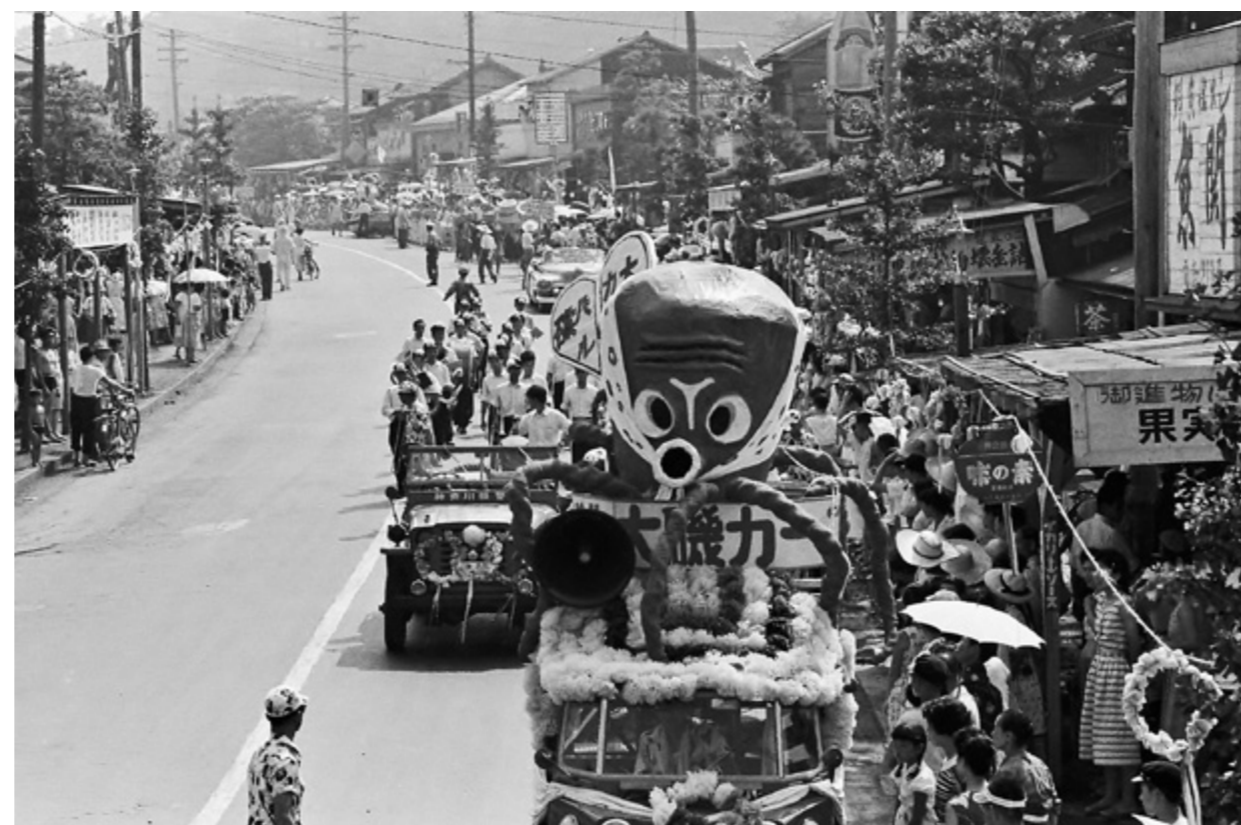
右に「魚関」の看板が見える（神明町付近）