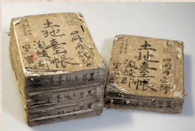
淘綾郡黒岩村「土地台帳」当館蔵

担当学芸員による 展示解説 10月28日(日) 14時から30分程度の予定 11月18日(日) 場所 郷土資料館本館 企画展示室