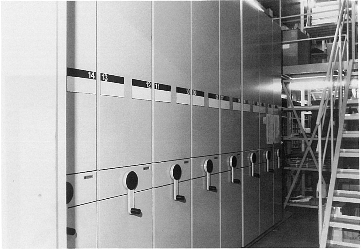
第3収蔵庫 スタックランナー購入