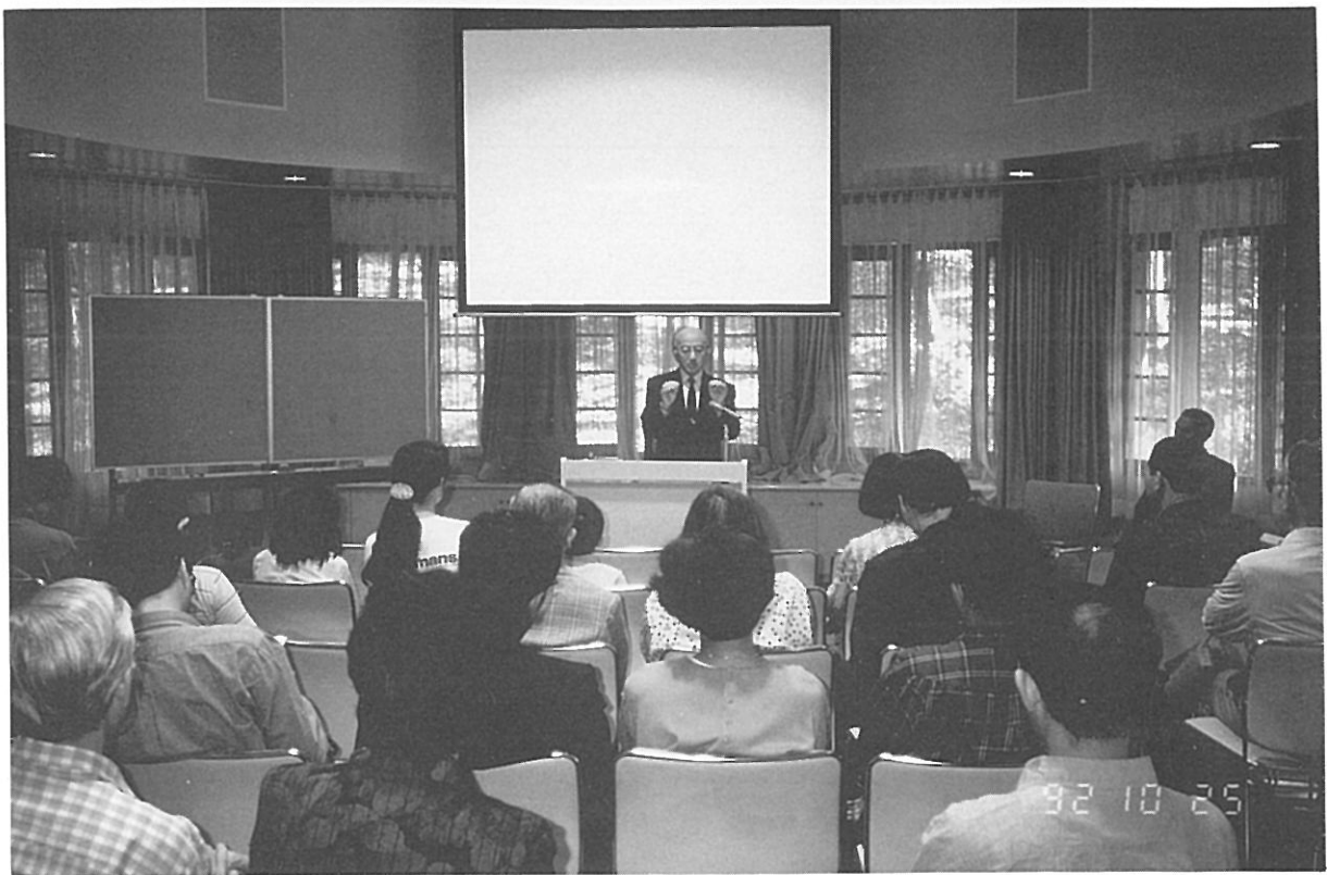
特別展 記念講演会