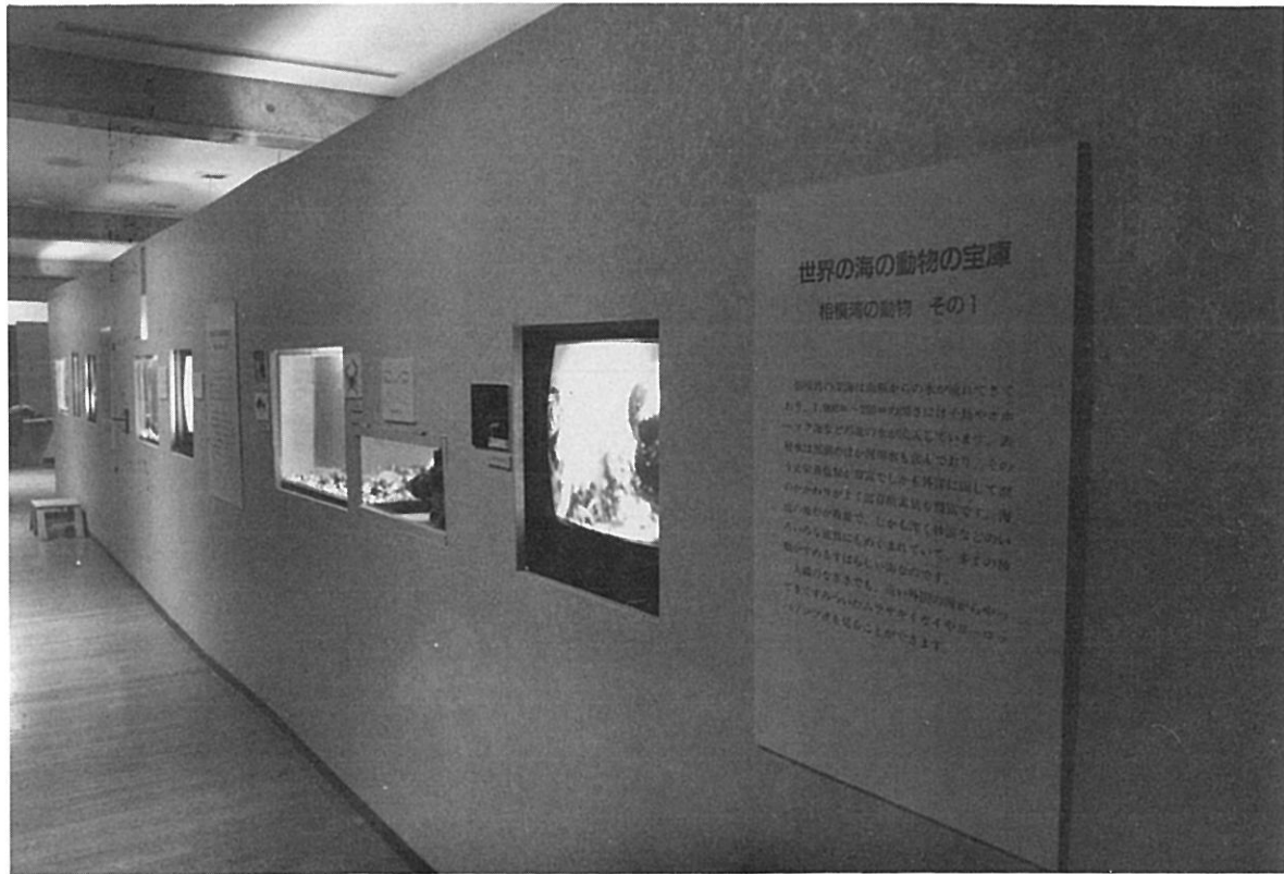
特別展「相模湾の動物」