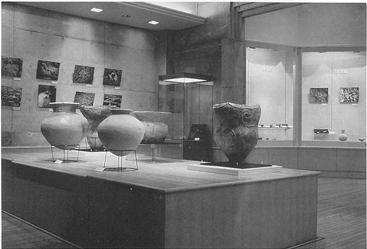
企画展「湘南の考古資料」