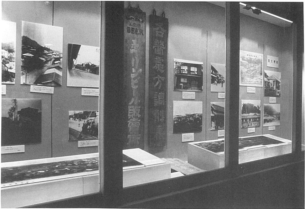
企画展「なつかしの風景Ⅱ～家と町並み～」