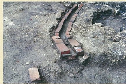
神明前遺跡(大磯町)