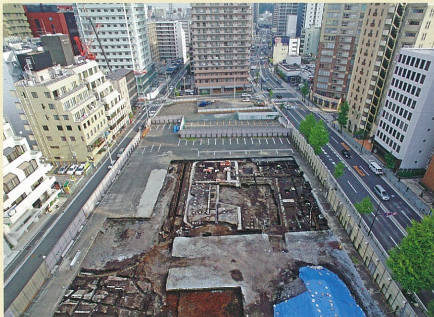
山下居留地遺跡(横浜市中区)