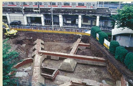
二代目横浜駅(横浜市西区)