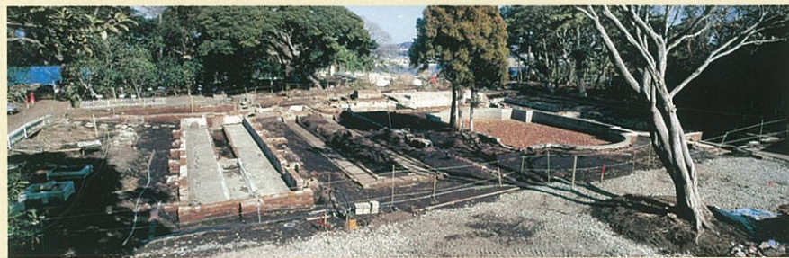
整備工事中の 江の島コッキング植物園温室遺構(藤沢市)