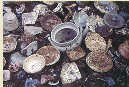
小田原城三の丸元蔵堀第三地点(小田原市)