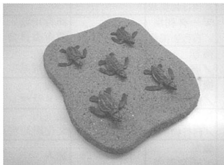
アカウミガメの剥製

木造神像保存処理委託／(有)光圓美術研究所 祭り船解体・組立（展示）委託／大磯御船祭保存会 動物剥製作製委託（アカウミガメ5体）／(有)ニヶ崎科学標本社