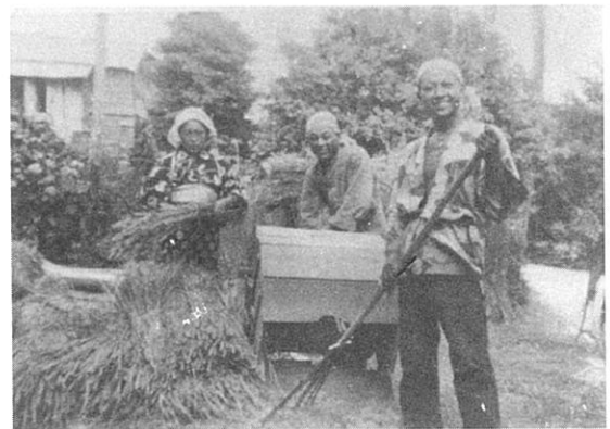
(写真1) 足踏脱穀機による脱穀作業

した。当地域では、通常「脱穀機」で意味が通るが、その後に出た動力脱穀機と区別して、「足踏脱穀機」もしくは単に「アシブミ」と呼ぶ場合が多い。当地域での足踏脱穀機の普及は、大正時代から昭和時代初期にかけてといわれている。例えば、西小磯で明治35年(1902)に生まれた男性は、マンガを使っていた経験があり、使う時期になると、たいてい行商が修理に回って来たので、歯の間を締めてもらったという記憶を持っている。そして、話者がどうやら1人前になった頃に足踏みの機械が入ってきたという 8) 。また、同所の大正8年(1919)生まれの男性は、子どもの頃にムギコキヤイネコキを使ったが、その後まもなくアシブミに変わったという。大磯町国府新宿の明治38年(1905)生まれの男性は、昭和の初めまでマンガを使った。大磯町高麗の大正13年(1924)生まれの男性は、センバで脱穀していたのは知らないという 9) 。なお、昭和9年(1934)7月に撮影された国府新宿における小麦の脱穀作業の写真では、足踏脱穀機にて作業をしている様子が写し出されている(写真1)。