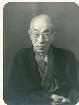
没年に撮影されたポートレート