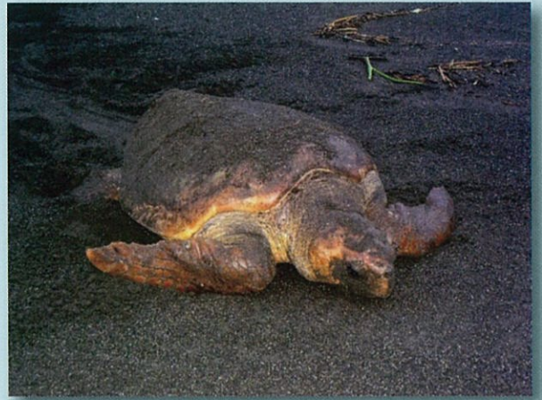
2004年7月30日午前5時頃、大磯町東町の海岸にて、佐川和裕さん撮影

このたびの企画展では近年のアカウミガメの上陸・産卵・孵化・脱出の状況やアオウミガメ、タイマイ、オサガメの確認状況を紹介します。展示をとおして、ウミガメの生態を知っていただくとともに大磯町の海辺の自然に興味を持っていただければ幸いです。