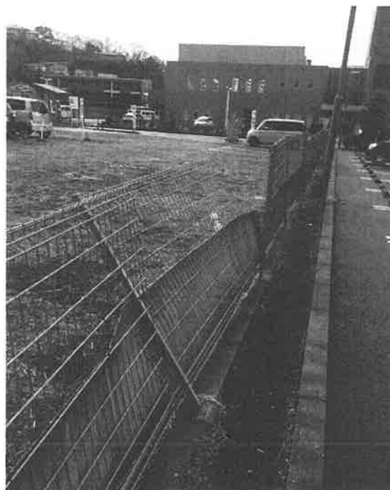
破損したフェンス