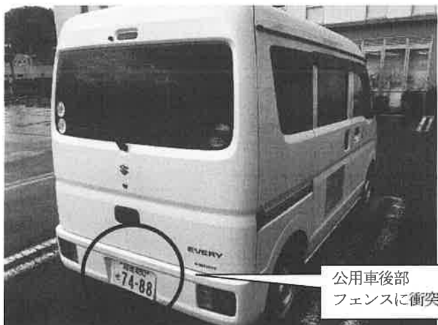
公用車後部 フェンスに衝突