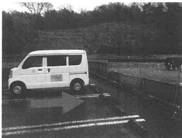
運転していた公用車