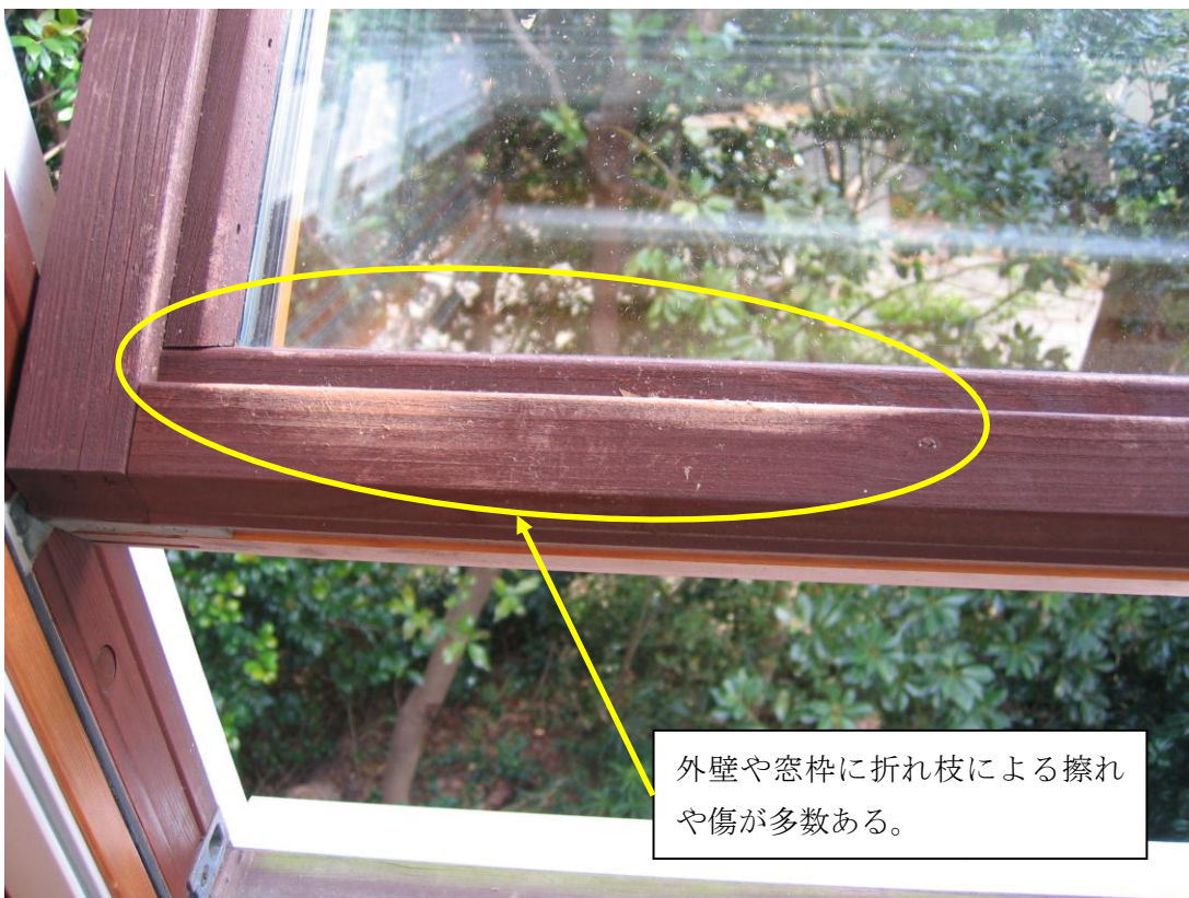
外壁や窓枠に折れ枝による擦れや傷が多数ある。