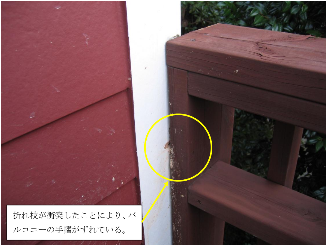
折れ枝が衝突したことにより、バルコニーの手摺がずれている。