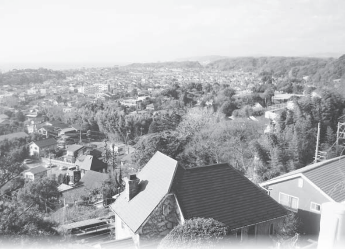
高田公園付近から

12月定例会を12月2日から16日までの会期で行った。陳情は10件提出され、そのうち7件を委員会に付託し審査した。結果、1件について関係先へ意見書を送付した。議案は人事案件1件、補正予算案5件を含め17件を審議し全て可決した。