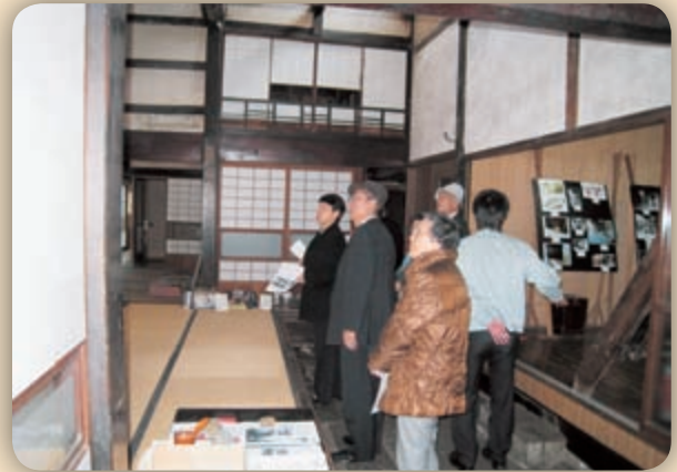
▲11月4～5日 総務建設常任委員会 新潟県柏崎市〔地震防災対応〕・上越市〔歴史的建造物を活かした高田市街地活性化の取組み〕を視察。