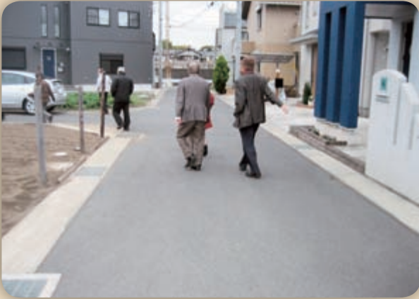
▲11月11日 総務建設常任委員会協議会 町道認定のため現地視察。