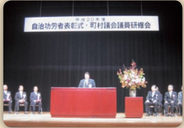
▲11月12日 県町村議会議員研修会 愛川町文化会館で日本体育協会副会長塚原光男氏が「果てしなき挑戦=金メダルへの道」を講演。