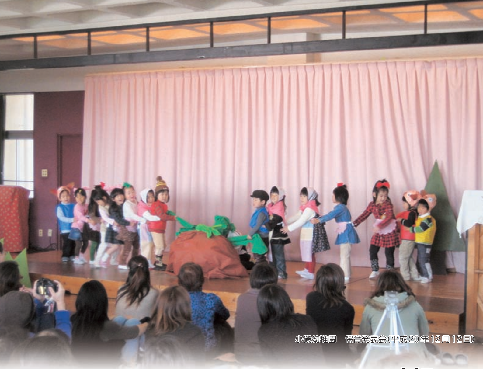
小磯幼稚園 保育発表会(平成20年12月12日)