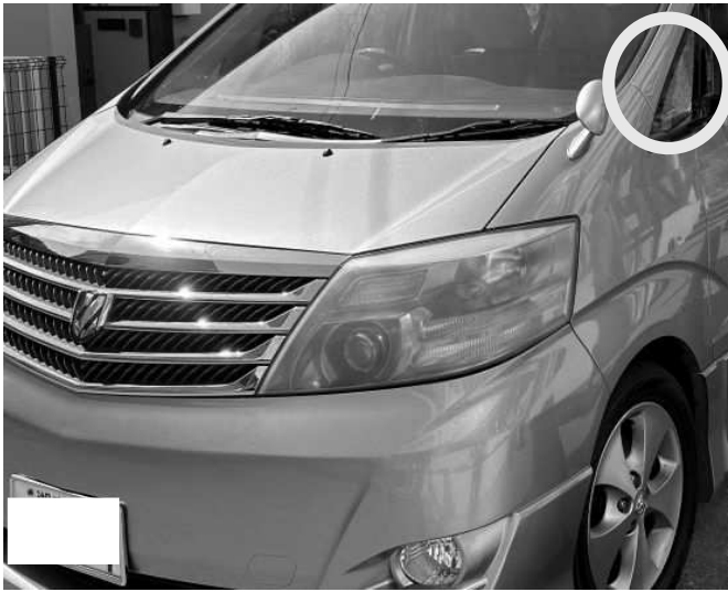
破損した車両左のフロントベンチガラス