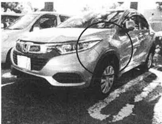
事故の相手方車両（普通乗用車）