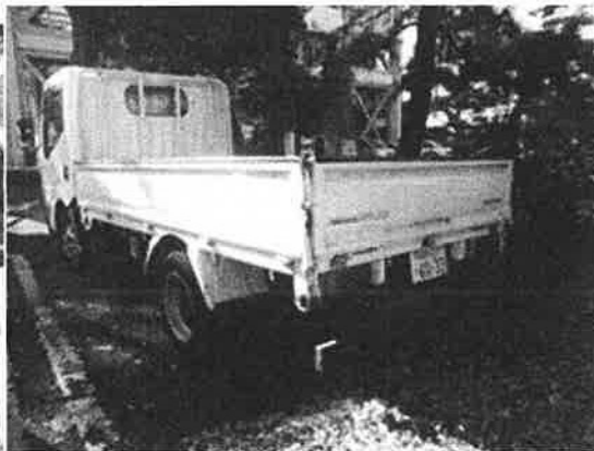
運転していた公用車（トラック）