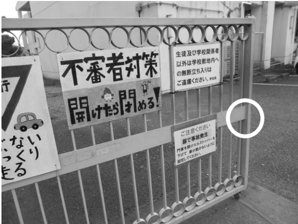
自家用車に衝突した門扉