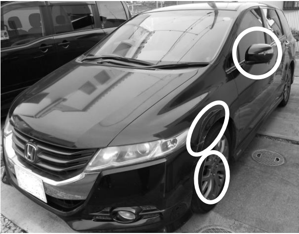
門扉衝突により破損した自家用車左部