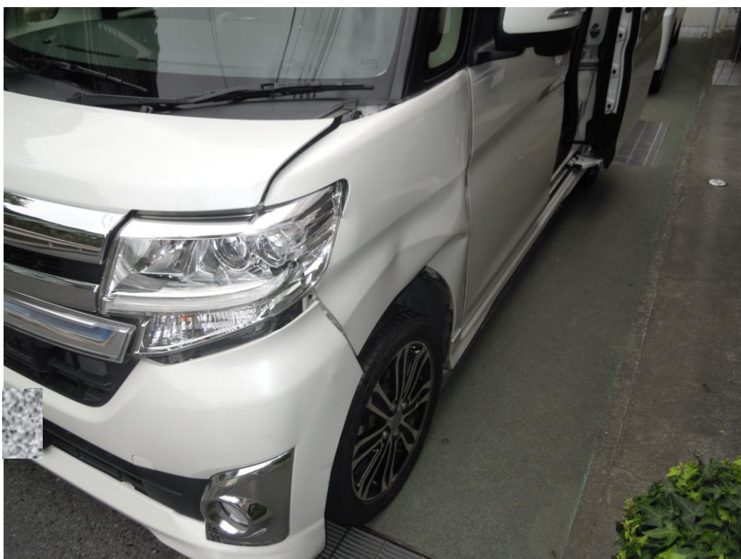
事故の相手方の自家用車