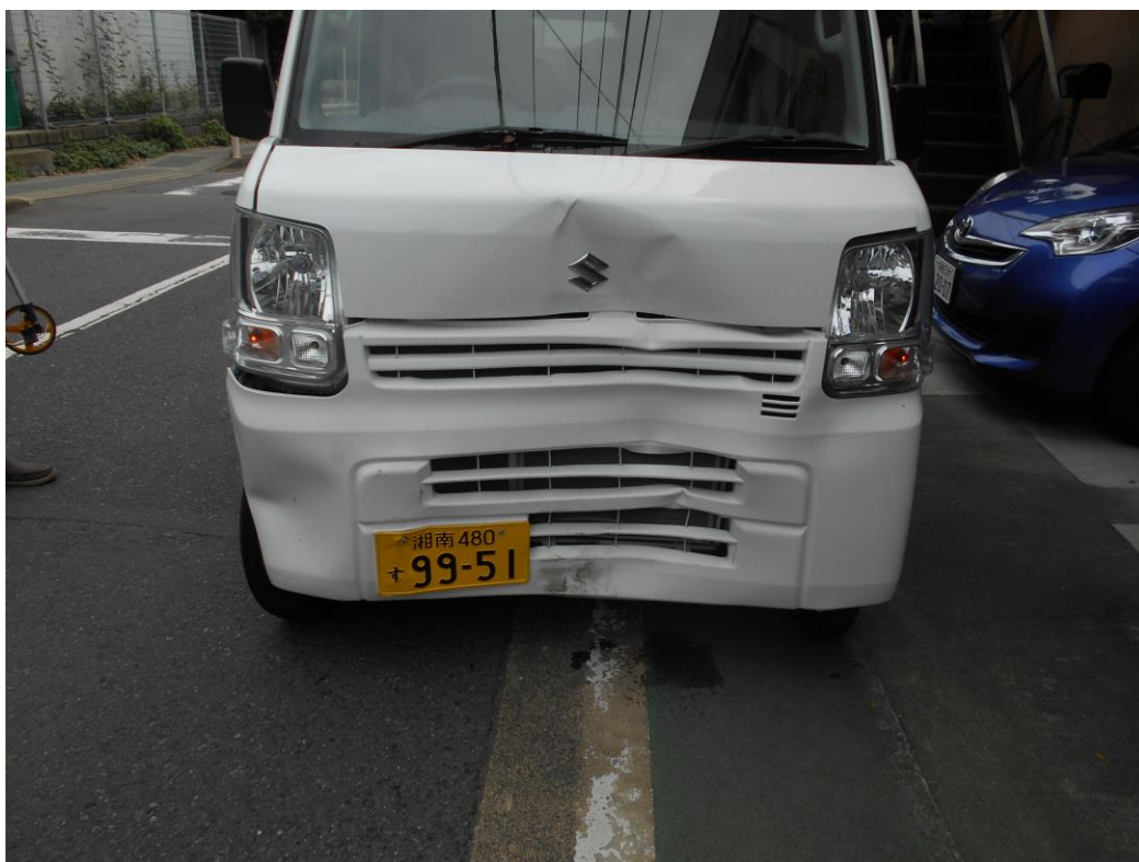
運転していた都市計画課公用車