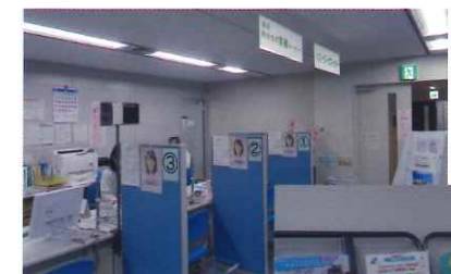
▲ハローワークコーナー

キャリアカウンセリングの中で、ご希望や適性等を考慮した求人企業とのマッチングを行い、職場体験を行うことで正規雇用を目指します。