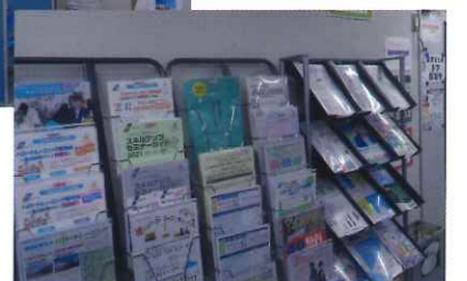
▲就職情報コーナー