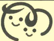
マザーズハローワーク

子育て中の方が、お子様連れでも安心して仕事探しができるように、ベビーカーでも入れるレイアウトにしたハローワークです。