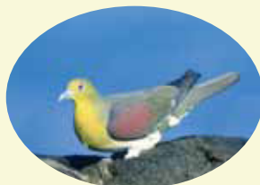
肩がブドウ色なのがオス