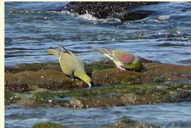
照ヶ崎海岸で海水吸飲するアオバト