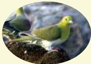
全体が緑色なのがメス