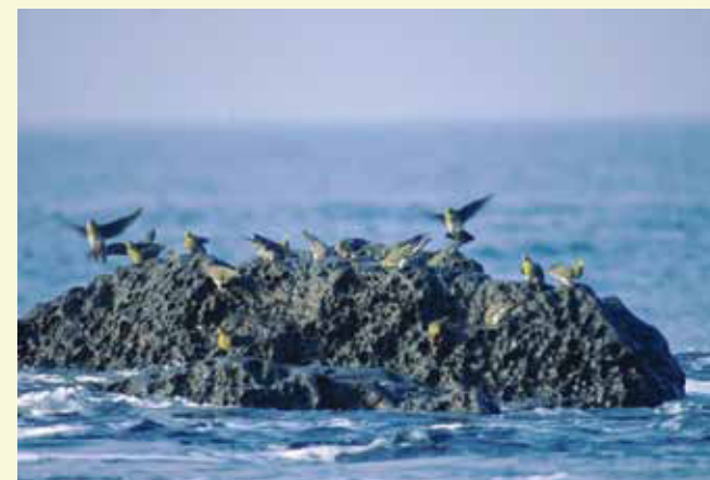
照ヶ崎海岸岩礁に舞い降りたアオバト