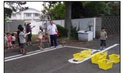
インディアカの的入れ