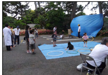
ストライクナイン・フラフープ