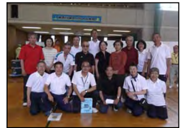
大磯町の参加者の皆さん

6月10日（日）に上記大会が横浜市神奈川地区センターにおいて、県内から30チーム90名が参加し、大磯町からは6チーム19名（内、町民8名）が参加しました。町の県大会の出場は2年ぶり3回目で、各試合熱戦が繰り広げられましたが、予選リーグ突破の壁は今回も厚く、残念ながら予選で敗退しました。しかし、「競争より協調」という原点を忘れずに今後も挑戦していきますので、次回は一緒に参加してみませんか。