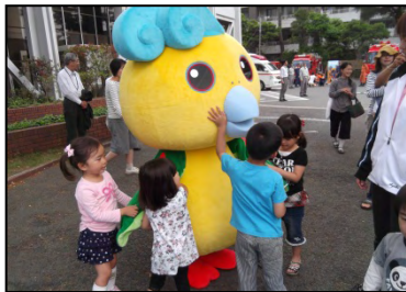
町の観光キャラクターの “いそべえ”も参加

6月3日（日）に行われた“歯の健康フェスタ2012”にスポーツ推進委員も協力しました。スポーツを通じて、町民の皆さんが健康で明るく豊かな生活を送れるよう、健康の大切さを啓発しました。