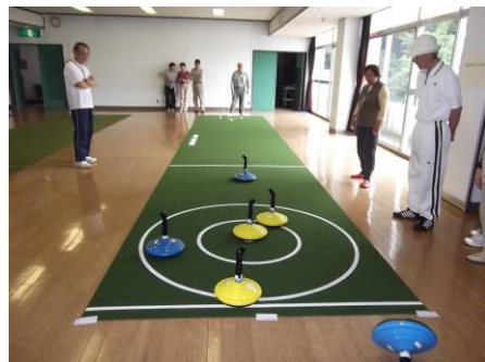
「生涯学習館での風景」

「こんな健康的で楽しいゲームを生涯学習館でもやって欲しい」と話したら、「開催することになりました。」との知らせを受け、早速友人も誘い参加しました。準備体操、ルール説明そしてゲームと心地よい汗をかき楽しく過ごせました。参加者は口々に「楽しかった。次も是非参加したい。」と言っており、今回参加しなかった知人は「次は私も仲間に入れて……」と楽しみにしています。これからも楽しく、健康に良いユニカール教室を続けて欲しいと思います。