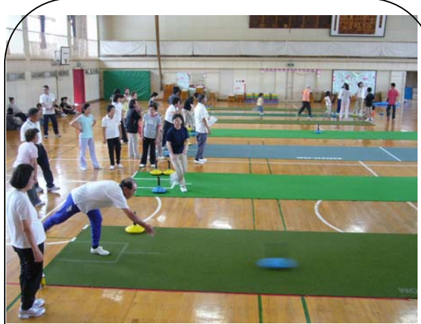
7/5(日)大磯小学校体育館 参加人数: 39 名

ユニカールは氷上のカーリングを陸上で楽しもうと考案され、良く滑るスライドカーペットの上を 3Kg のストーンを滑らせて 10メートル先のサークルの中心に近づけることを競う競技です。