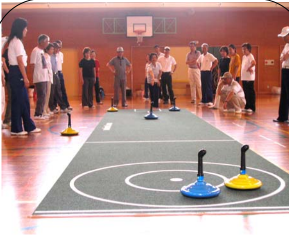
6/20(土)国府小学校体育館 参加人数: 38 名