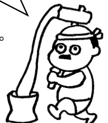
平塚市消費生活センターマスコット キャラクター「もちつけおじさん」