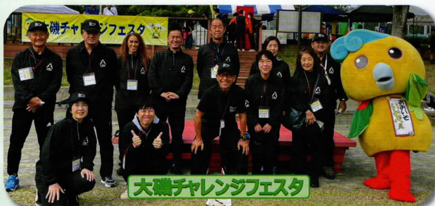
大磯チャレンジフェスタ