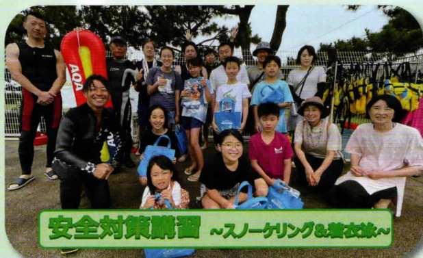
安全対策講習 ～スノーケリング&着衣泳～