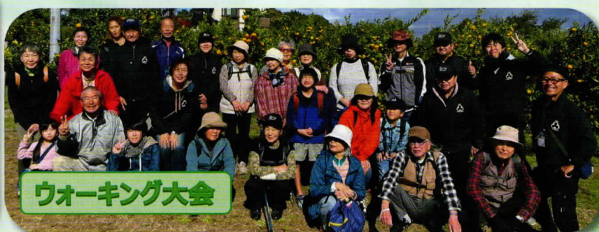
ウォーキング大会