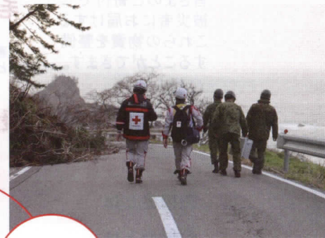
▲寸断された道路を自衛隊員と進む同救護班(石川県珠洲市)