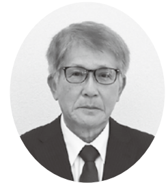
▲教育長 府川 陽一

退職後は、平成26年12月から二宮町教育委員会教育長、平成30年12月から令和2年6月まで二宮町副町長を務める。