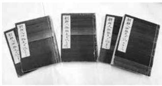
▲朝鮮人御馳走日記

本展では、兵庫県明石市に保管されている大磯宿の朝鮮通信使接待に関する資料を展示しています。なぜ、大磯宿に関する資料が、遠く離れた明石市で見つかったのでしょうか。