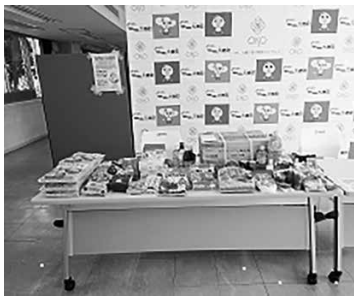
▲ 過去に実施したフードドライブの様子

『年末年始で買すぎた…』 『お歳暮が使い切れない…』 そんな食品をお持ち寄りください！