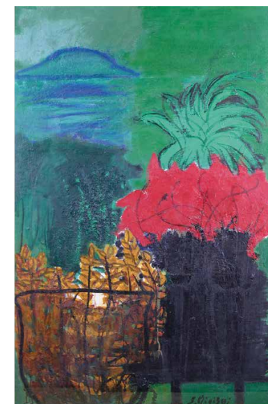
海にのぞんだ窓(1964年)