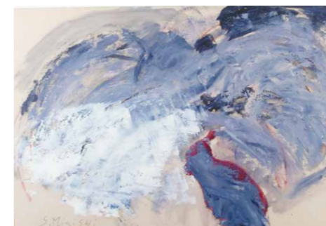
さいたさいたさくらがさいた(1990年代)