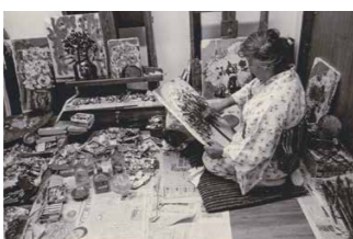
大磯のアトリエにて(1970年代)