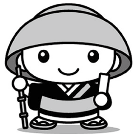
鳴立庵大使「えんいくん」