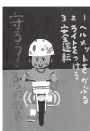
令和4年度大磯町交通安全ポスター

■交通安全指導隊員、大磯・二宮交通安全母の会会員の募集 地域の交通安全を守るため活動している団体です。各季交通安全運動や入学式において啓発を行っています。