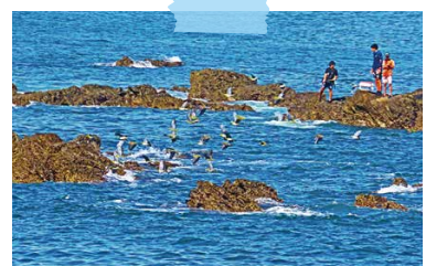
アオバトと磯釣りを楽しむ (9/2 照ヶ崎 木原さん撮影)