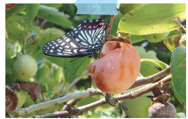
豆柿を食事中のタテハチョウ (8/29 郷土資料館前)