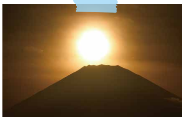
ダイヤモンド富士 (9/1 城山公園)