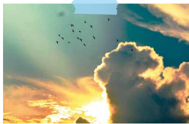
夕日にアオバトの群れ (8/20 大磯港)