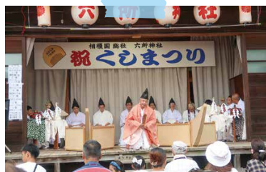
榎祭り (9/2 六所神社)