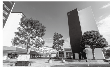
JR東海道線「平塚」駅 バス20分 徒歩1~3分