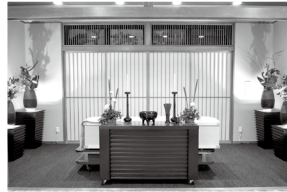
家族葬・一般葬式場「黒松」(~50席) 式場を区切り、少人数の家族葬も対応