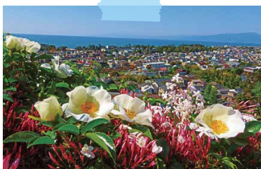
季節の花から俯瞰