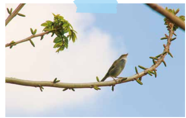
ウグイスのホーホケキョ