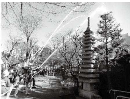
▲令和3年度の様子(善福寺)

荒天や警報発令、火災・災害の発生や、新型コロナウイルス感染症拡大防止のために、中止する場合があります。