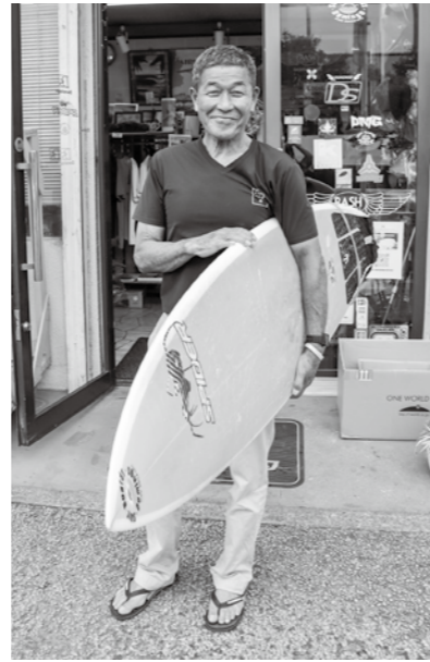
シヨートボード競技出場