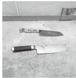
包丁が2本混入していました

分別の際は、町で配布している「ごみと資源の分け方・出し方ガイドブック」や町ホームページを活用してください。