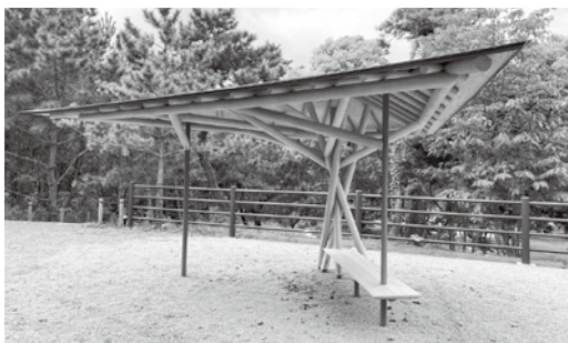
※四阿（あずまや）は建築家 隈 研吾氏の設計です