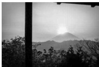
▲春のダイヤモンド富士(旧吉田茂邸銀の間から)