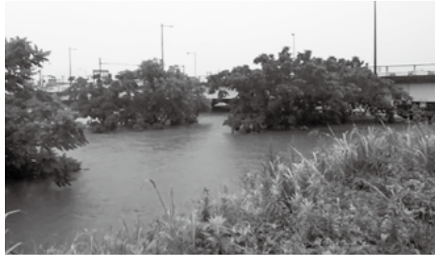
▶令和3年7月大雨時の高麗大橋の様子