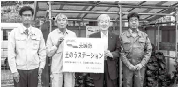
▲大磯建設協会から贈呈されました