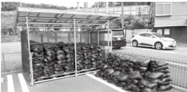
▲土のうステーション

大磯建設協会からの寄贈を受け、大雨等による浸水などの水害から住宅等を守るため、自助・共助の活動支援として、いつでも土のうを持ち出せる「土のうステーション」を町内に2か所設置しました。 集中豪雨や台風などによる大雨が予想される際、土のうが必要な場合には事前の備えとして、自由に使うことができます。 【利用にあたって】 土のうステーションの利用にはルールがあります。利用の際には土のうステーションに掲示してある、利用方法や、町ホームページをご確認ください。