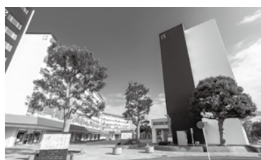
JR東海道線「平塚」駅 バス20分 徒歩1～3分