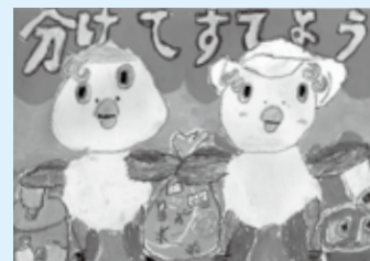
▲令和2年度入賞作品