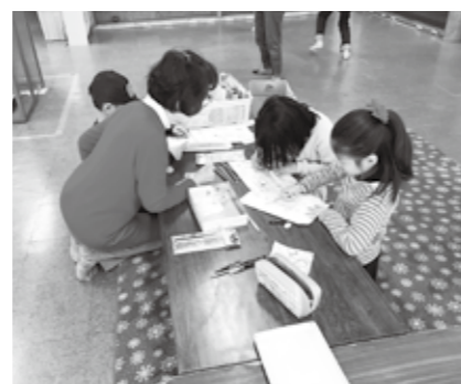
▲子どもたちの活動の様子