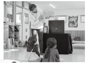
ママと一緒に おはなしタイム