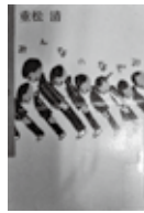
みんなのなやみ 重松 清 / 著 イースト・プレス

11月6日(金)~8日(日)に開催した第19回大磯図書館まつりには、140人の来場者があり、いそちゃん募金は22,026円のご協力がありました。大磯図書館まつり実行委員会では、この募金で児童書を購入し、図書館に寄贈する予定です。ありがとうございました。