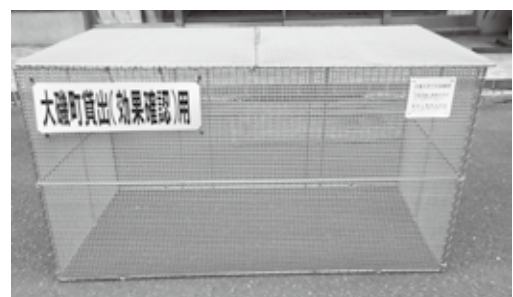
サイズは1.2mと1.8mがあります。 ※写真の折畳み式集積ボックスは1.2mサイズ