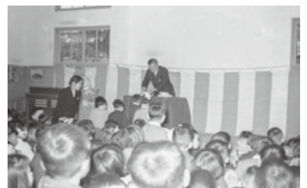
▲新築の大磯幼稚園

です。大磯では、町営の大磯幼稚園ができる前の明治時代から私設の幼稚園があり、町営化の動きも早くから行われていました。