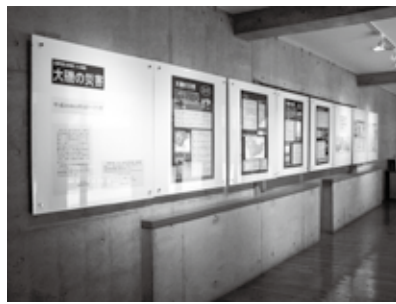
▲前回のミニ企画展「大磯の災害」